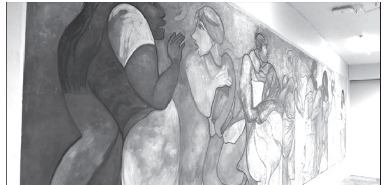
Mural Por una humanidad sin fronteras