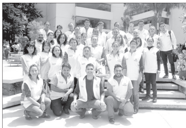
Los “Guardianes de la Salud” brindan orientación y apoyo

Para concluir compartió que se ha inscrito a clases de salsa, ya que por herencia tiene familiares diabéticos y debe tomar medidas de prevención.