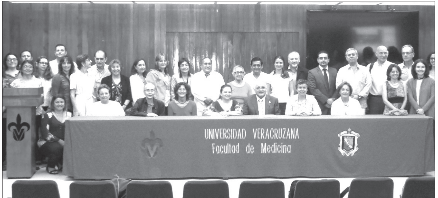
Académicos de ocho países participan en el proyecto

Los pacientes, abundó, reciben atención en diversos