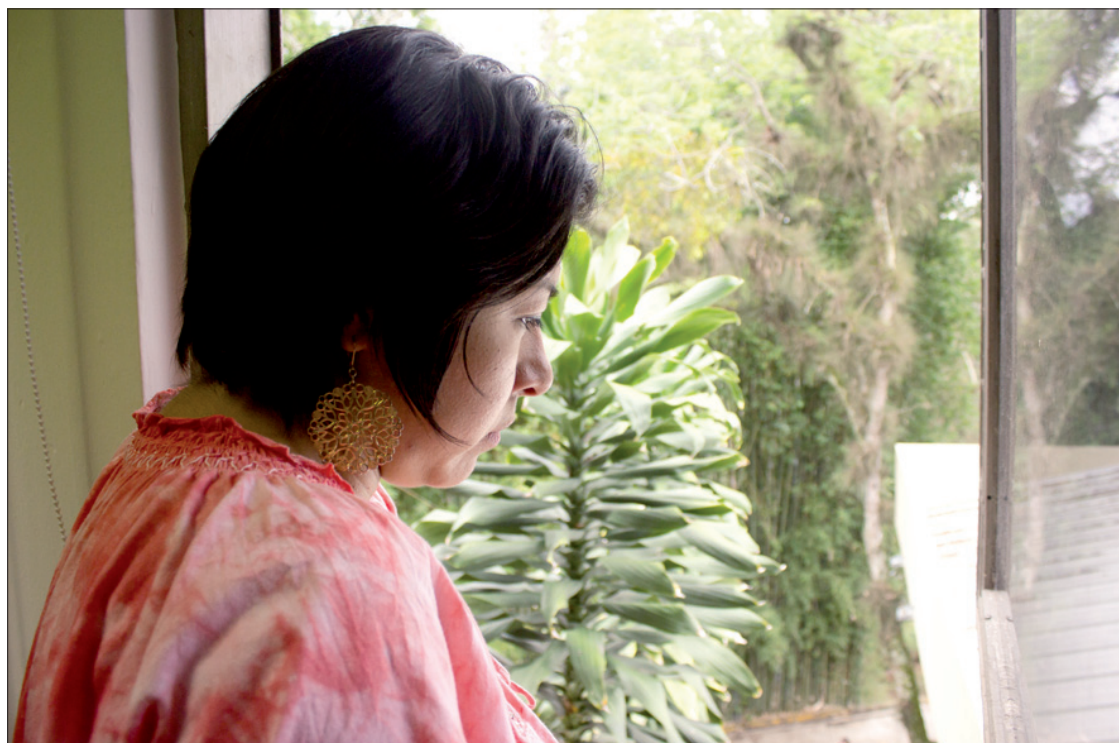
La supresión emocional se asocia con la angustia y el estrés

"Para curarnos, lo que hay que hacer es investigar en nuestro interior y buscar la causa de la enfermedad. Hay que apartar la mirada del síntoma y de la enfermedad y buscar más allá, ir al origen, ir a la raíz del problema."