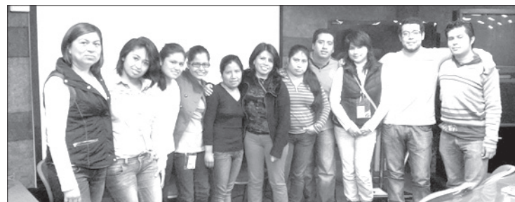
Integrantes de las BUSS con las facilitadoras