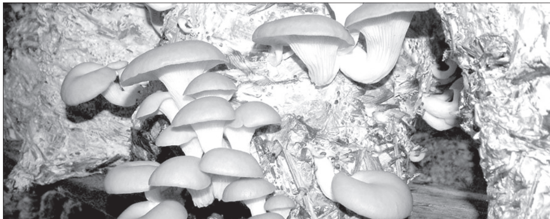
Los hongos son primos en primer grado de los animales

¿Quién lo hubiera pensado? Ahora resulta que hasta la roya del café es nuestra prima. En fin, como dice otro refrán, “sucede hasta en las mejores familias”.