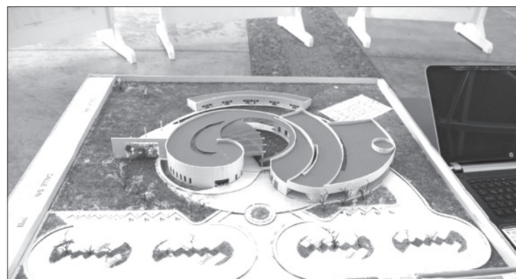
Los proyectos reflejan lo aprendido en las aulas