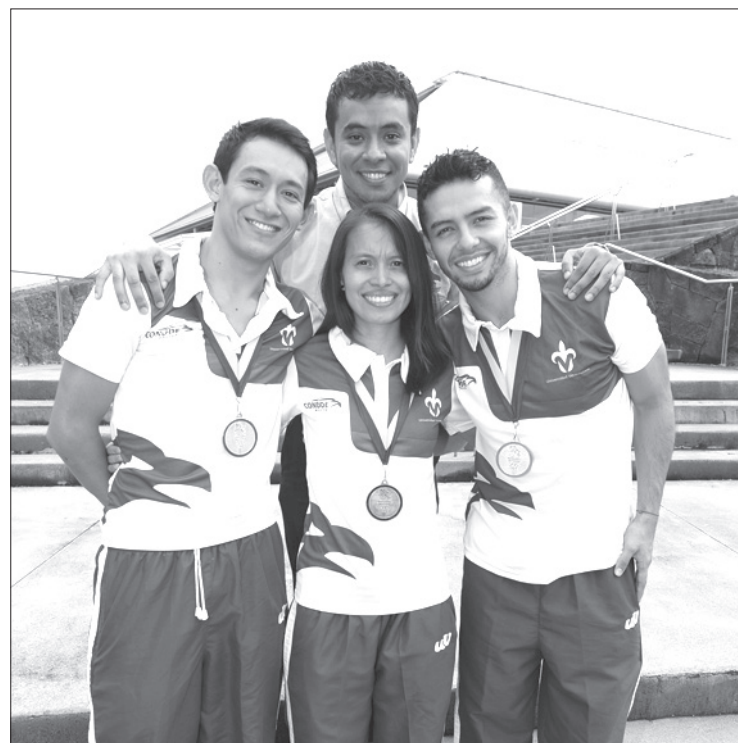
Han destacado en eventos nacionales e internacionales