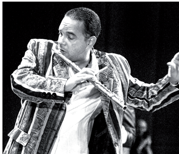
Orlando “Maraca” Valle

Para mayores informes sobre el 7° Festival Internacional Jazzuv , consultar el sitio: www.uv.mx/jazzuv/festival-jazzuv/ y en Facebook: /FestivalJAZZUV y Twitter: #FestivalJazzUV.