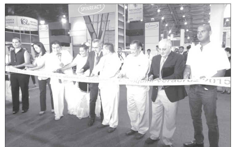
El Vicerector inauguró la Expoquim 2015