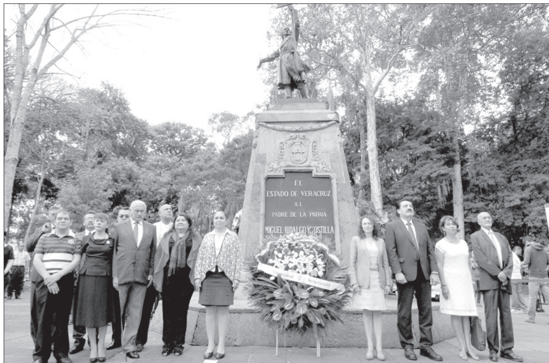
Funcionarios, líderes gremiales, académicos y estudiantes participaron en el acto