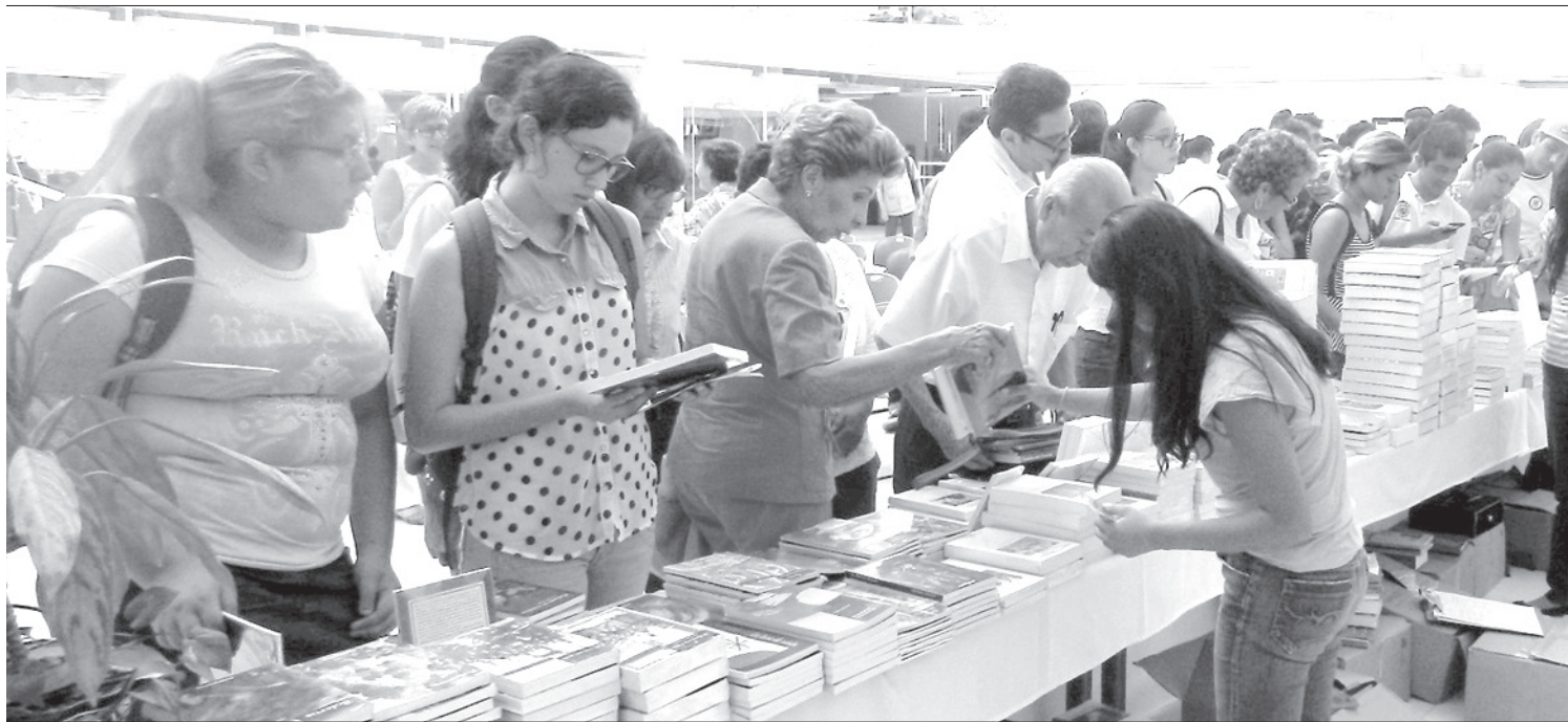
En la feria del libro se ofrecieron grandes descuentos