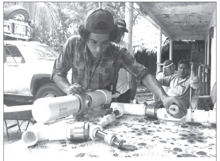
En el evento se mostró la estructura de la bomba hidroariete

Al encuentro asistió personal docente de la UACH, representantes de organizaciones campesinas de Guerrero, Puebla, Veracruz, Yucatán y Tlaxcala. El propósito de la asistencia de la UVI Huasteca fue diverso, se concretó en la generación de espacios de vinculación, aprendizajes y participación entre docentes, estudiantes y campesinos de ésta y otras