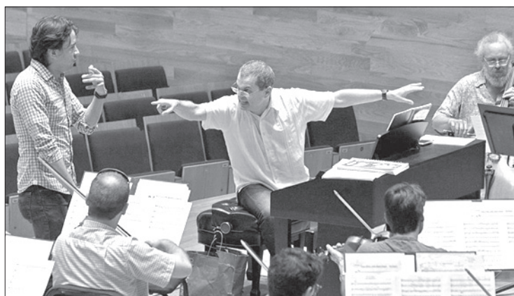
Es titular de la OSX

Todo participante deberá preparar previamente el programa a presentar y enviar un video vía link YouTube al correo: audiciones.osx@gmail.com , dirigiendo un concierto o ensayo. Esta grabación no debe ser mayor a 15 minutos.