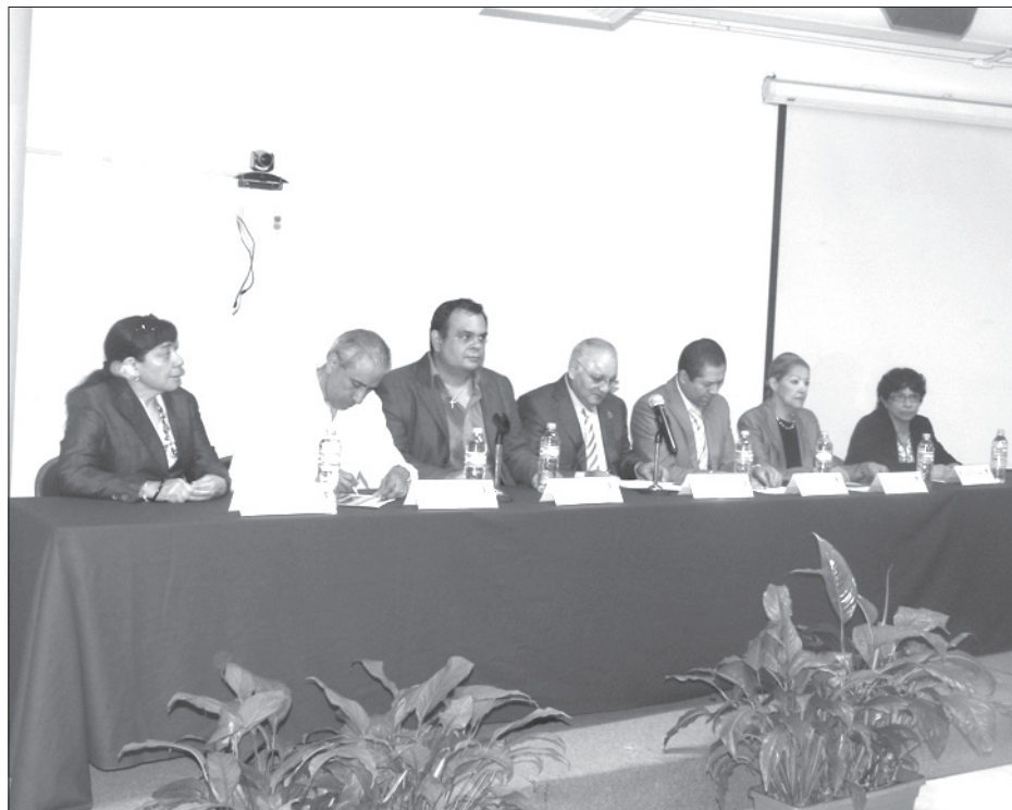
El Vicerrector presidió la inauguración