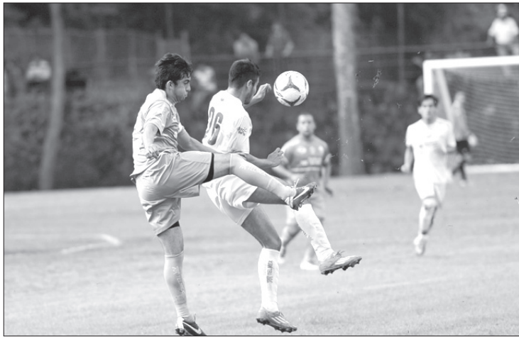
Se impuso con marcador de 4-3 a Linces de la UVM

La escuadra de la UV tuvo que venir de atrás para sacar la victoria, pues al término del primer tiempo perdía con marcador de 1-2, con goles de Irving Cuauhteca por los visitantes, y Misael Soto por los Halcones .