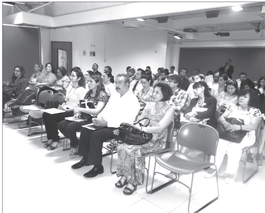
Asistentes al congreso